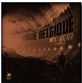
Nightwalker Vol.2 (Dusted Wax Kingdom) 2014