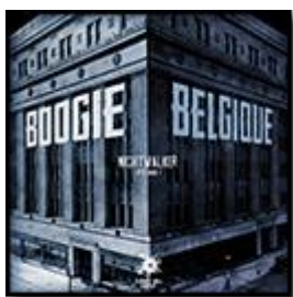
Nightwalker Vol.1 (Dusted Wax Kingdom) 2013