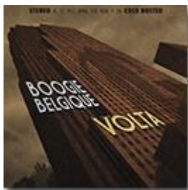
Volta (Cold Busted) 2016